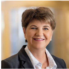
Frag die Bundespräsidentin: Generationen im Dialog Bundespräsidentin Viola Amherd Vorsteherin Eidgenössisches Departement für Ver- teidigung, Bevölkerungsschutz und Sport VBS